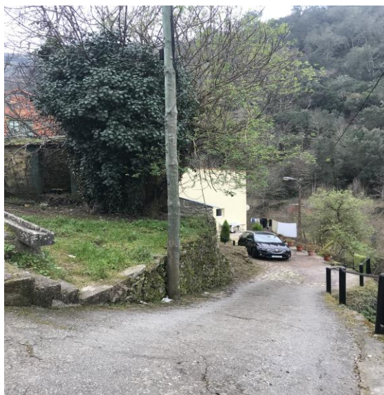
Figura 7 – Arruamento público

----- Santa Marta de Penaguião, 18 de maio de 2023. -----