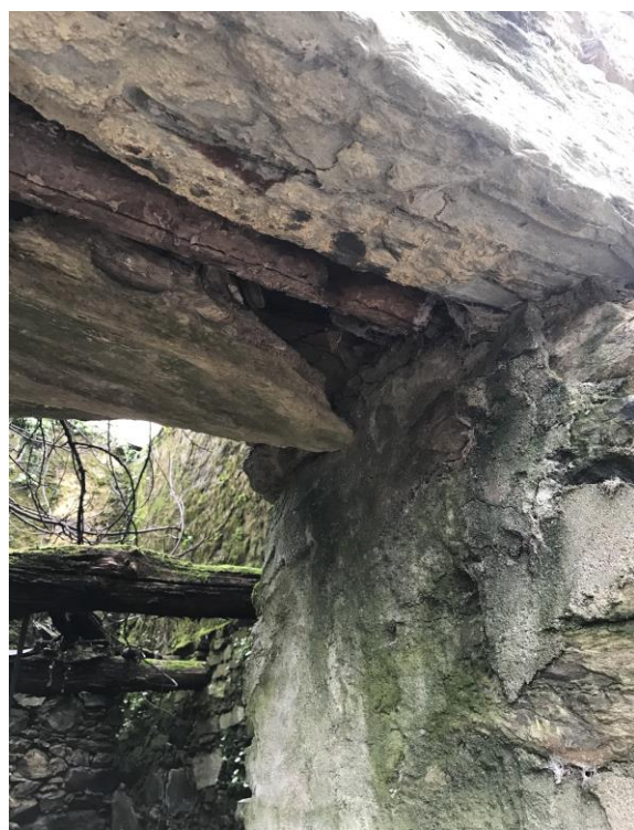
Figura 4 – Interior da habitação