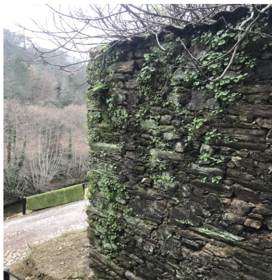
Figura 6 – Fachada sul